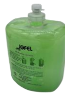
AT18706 8427950382437 Aloé