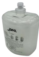
AT18606 8427950382420 Shampooing

CARTOUCHES DE DOSAGE OPTIQUE SHAMPOING, ALOËS, MOUSSE, SENSIBLE