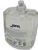
AT19806 8427950382444 Sensitive