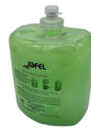
AT18706 8427950382437 Aloe vera