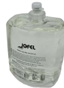
AT19806 8427950382444 Sensitiv