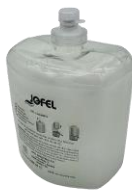
AT18606 8427950382420 Shampoo

KARTUSCHEN FÜR SPENDER MIT SENSOR SHAMPOO, ALOE VERA, SCHAUMSEIFE, SENSITIVE