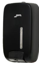
ACR23600 8427950378461 Черный