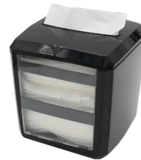
AH54000N 8427950356926 Noir