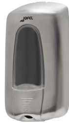
AC74000 8427950375897 Edelstahl, satiniert