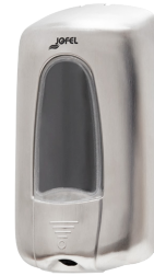
AC74500 8427950375903 Edelstahl, Glanz