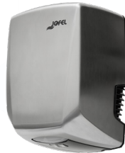
AA57500 8427950367540 Edelstahl satiniert