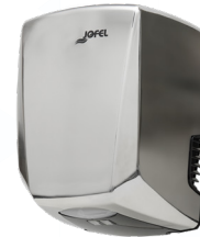
AA57000 8427950367502 Edelstahl glanz