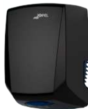
AA56600 8427950367427 Черная отделка