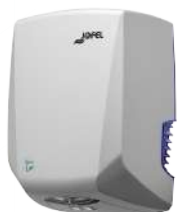
AA56300 8427950367380 Серебристая отделка