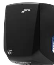
AA56600-MT 8427950367427 Матовая черная отделка