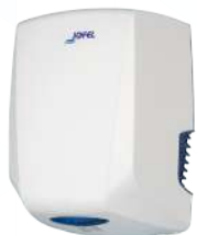
AA56000 8427950367342 Белая отделка