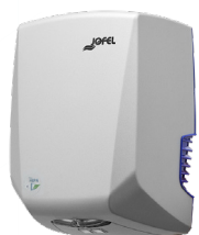
AA56300 8427950367380 Ausführung: Silber