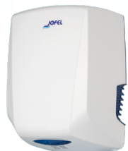
AA56000 8427950367342 Ausführung: Weiß