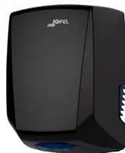
AA56600 8427950367427 Ausführung: Schwarz