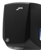
AA56600-MT 8427950367427 Ausführung: Schwarzmatt