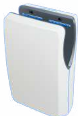
AA25050 8427950350566 Белая отделка