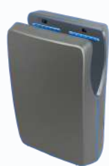
AA25950 8427950353970 Отделка графитового цвета