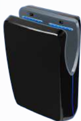
AA25650 8427950354656 Черная отделка