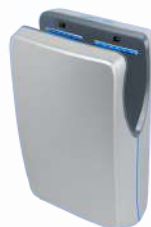
AA25550 8427950350573 Серебристая отделка