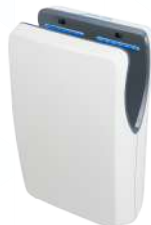
AA24050 8427950360596 Белая отделка