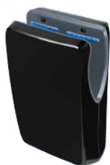
AA24650 8427950360619 Черная отделка