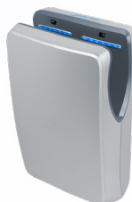
AA24550 8427950360602 Acabado Plateado