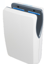
AA24050 8427950360596 Acabado Blanco