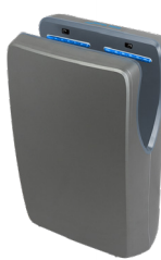
AA24950 8427950360626 Acabado Grafito